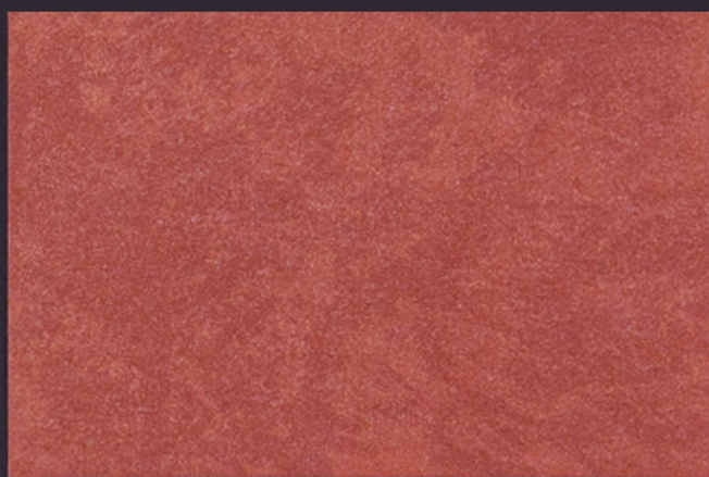
ETNIKA RAME FIAMMINGO + LUMIR / 1 T. su FONDO SIENA